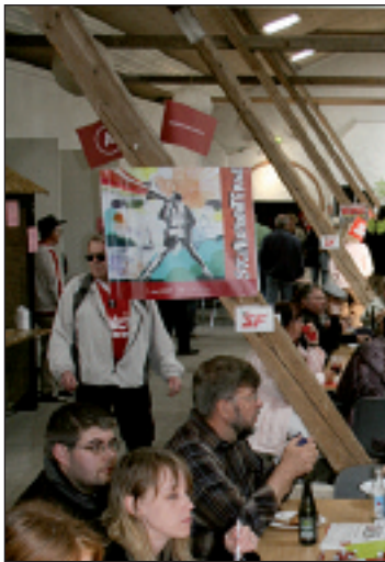
Tæt besat af 1. maj fans.