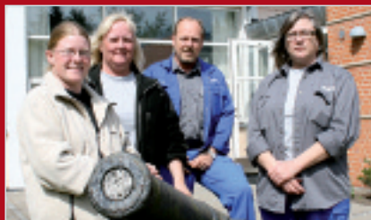
14 nyansatte på AMA 3F deltog aktivt med at skaffe medarbejdere