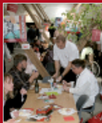
1. maj 2007 blev besøgt af mange flere